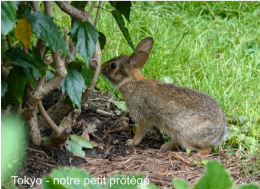
Tokyo - notre petit protégé